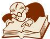
TABLE DES MATIERES